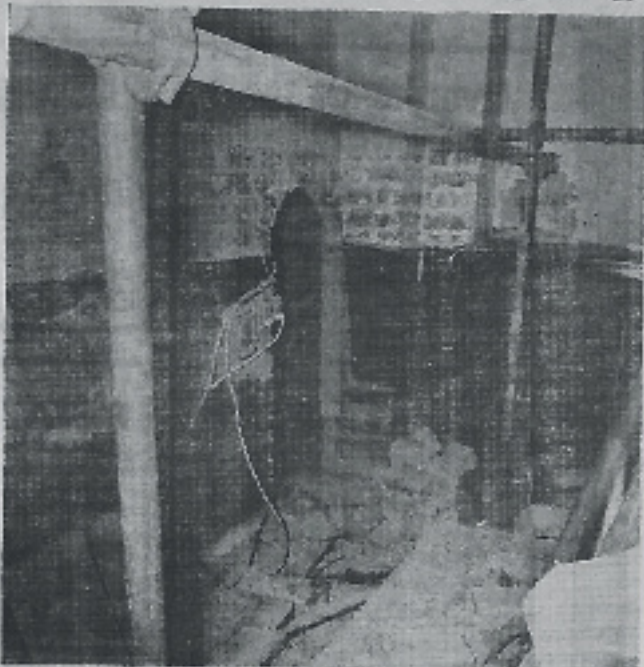
Fra Sct. Mortens åbnes indgangen til den gamle vindeltrappe, som førte fra tårnrummets bund op til hvælvingerne.

Som tidligere omtalt i Ugebladet har man afdækket den tilmurede indgang til gangen eller rummet, fra hvilken den gamle vindeltrappe fører op til Sct. Mortens Kirkes hvælvinger.